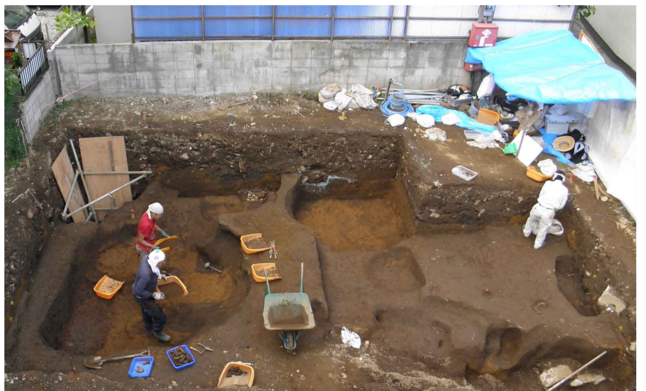
発掘現場の調査風景

徳利が出土した状況 「スガモ」の文字が書かれた徳利。巢鴨遺跡では、このような徳利がたくさん出土します。